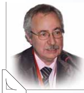
Евгений Иванович КУЗЬМИН, председатель Российского комитета Программы ЮНЕСКО «Информация для всех», председатель Межправительственного совета Программы

нологий (ИКТ). Задуманная в 1999 г., она была разработана в 2000–2001 гг. и официально учреждена в 2001 г. как флагманская межправительственная программа, призванная заложить основу для международного сотрудничества и партнёрства в интересах «создания информационного общества для всех». Участвующие в ней правительства государств – членов ЮНЕСКО обязались использовать новые возможности информационного века для создания справедливого общества посредством расширения доступа к информации. Построение информационного общества возможно только при наличии соответствующей политики, последовательных действий как на глобальном, так и на национальном уровне. Построение такого общества связано с масштабной и трудоёмкой интеллектуальной, политической, просветительской, организационной и практической работой в самых разных, но взаимосвязанных областях: например, телекоммуникаций, технологий, науки, образования, культуры и т.д. При этом требуются согласованные, скоординированные усилия представителей всех этих сфер в рамках единой национальной (государственной) политики – комплексной, многоаспектной, сбалансированной. Проблема формирования такой политики остро стоит сегодня и на международном, и на национальном уровне. Эффективная политика построения плюралистического информационного общества (по-другому его называют «информационным обществом для всех», «обществом знаний») может формироваться исключительно на